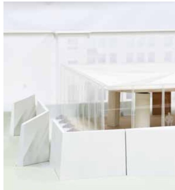
Nasjonalmuseet – Arkitektur, utstillingspaviljongen – byggesett