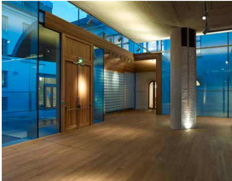
Nasjonalmuseet – Arkitektur, utstillingspaviljongen – interior