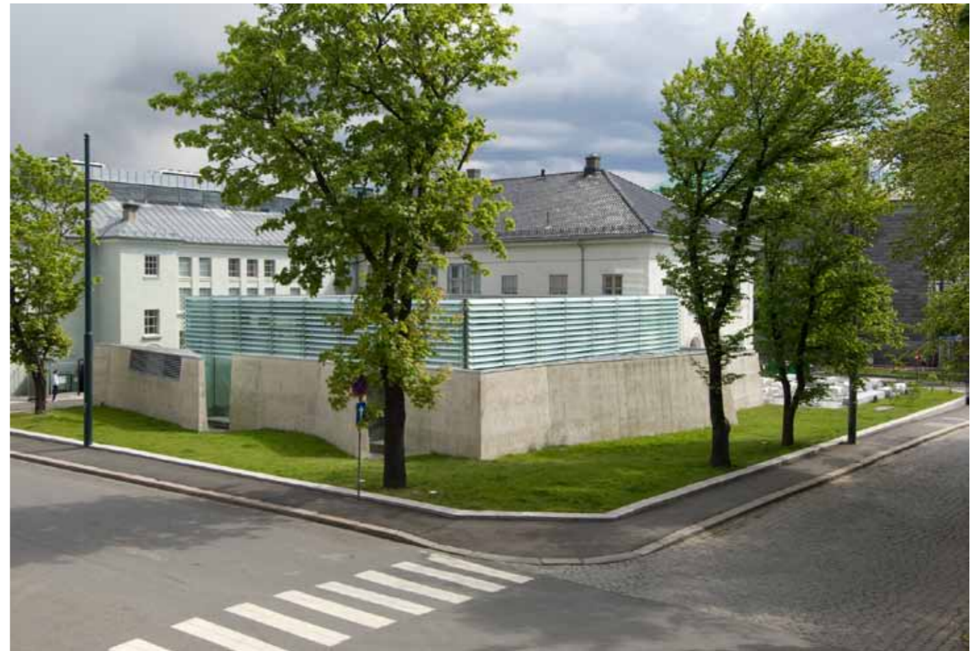
Nasjonalmuseet – Arkitektur med utstillingspaviljongen i forgrunnen