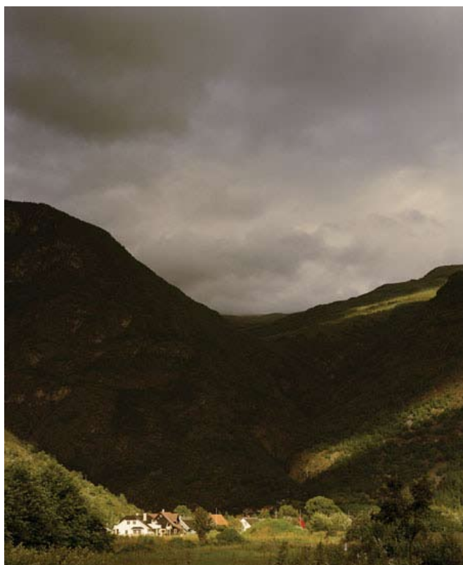
Una Line Ree Hunderi (NO), Domestic landscape, foto på MDF, 2004

Vandreutstillingen er produsert av Punkt Ø AS i samarbeid med Østfold kulturproduksjon. Punkt Ø AS er fylkesgalleri for Østfold og driver både Galleri F 15 og Momentum. Punkt Ø AS, Postboks 1033 Jeløy, N-1510 Moss. Tel.: +47 69 27 10 33. www.gallerif15.no