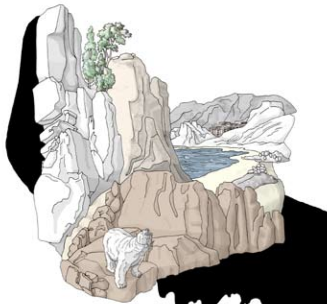
Tiril Schrøder (NO), Settlement, digitalprint og akryl på lerret, 2007