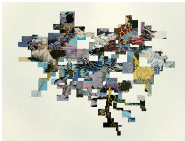
Siv Bugge Vatne (NO), Ice Inside a Cloud II, collage, 2008