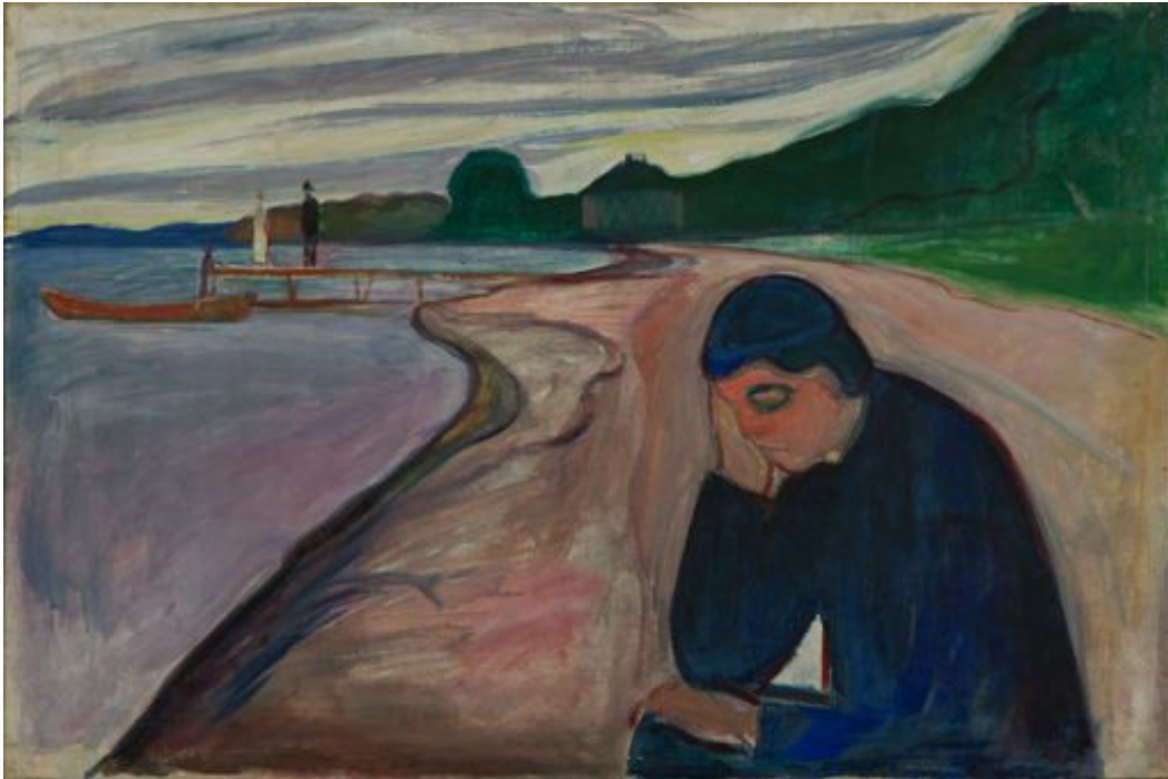
Forelegg no 2: Edvard Munch: Melankoli, 1893.

© Munch-museet / Munch-Ellingsen gruppen / BONO 2013. Foto: © Munchmuseet