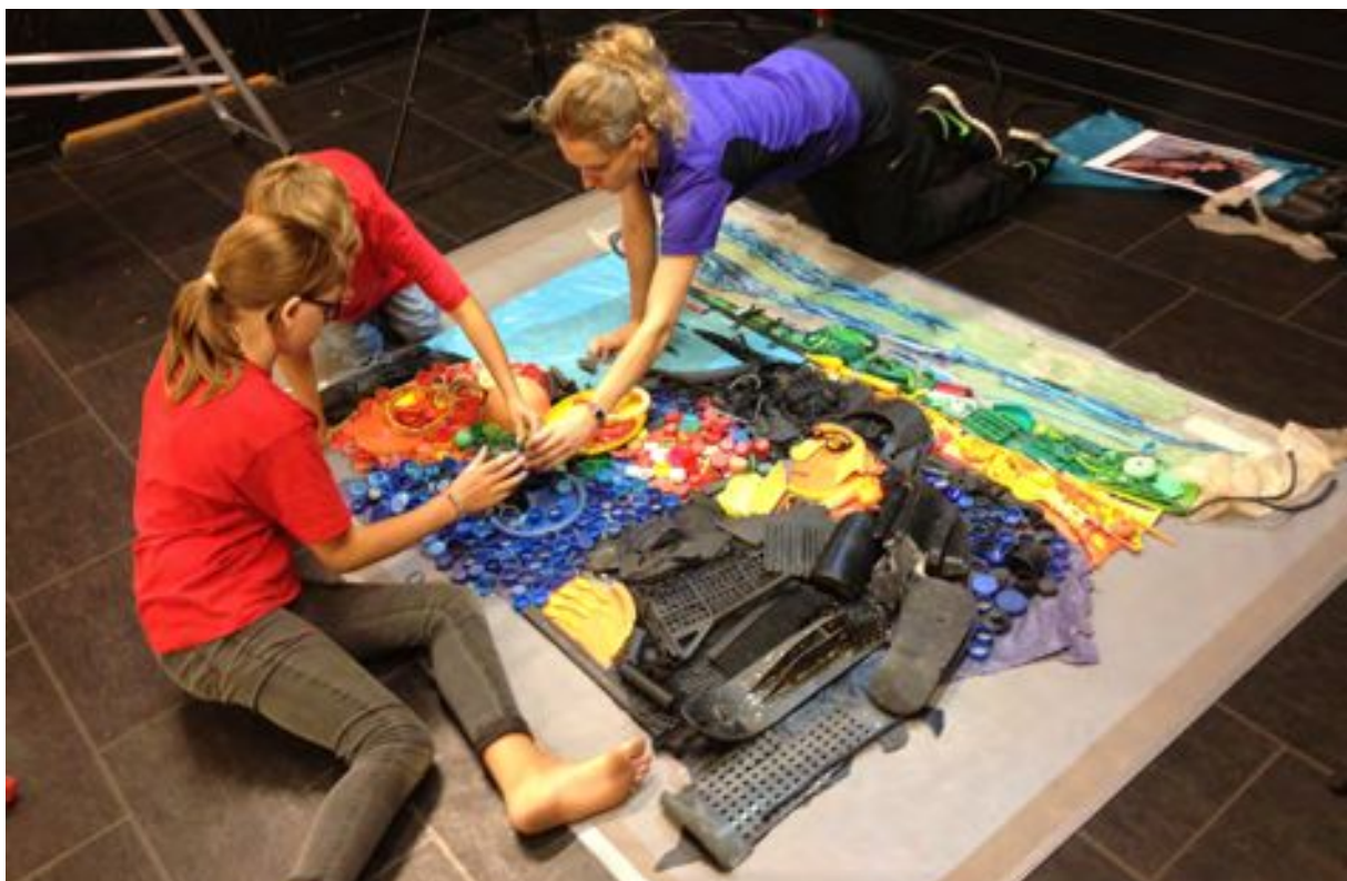
Framnes skole gjenskaper Edvard Munchs Melankoli, 1894 - 96.

Han var alene. Bølgene gled ensformig opp mot han, og det tuslet og tuslet mellom stenene.