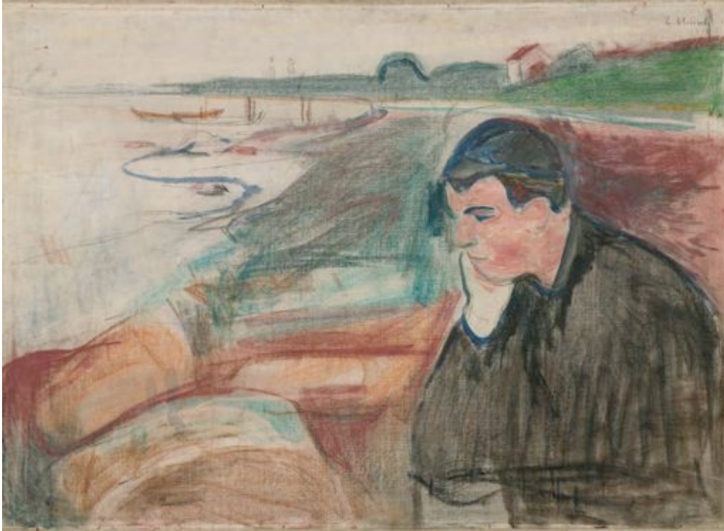
Eksempel: Edvard Munch: Aften Melankoli, 1891.

© Munch-museet / Munch-Ellingsen gruppen / BONO 2013.