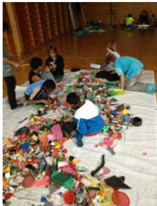
Gjennom sortering etter form og farge forvandles strandplasten til kunstmaterialer. Samarbeidet og prosessen fram til ferdig bilde er like viktig som sluttresultatet.