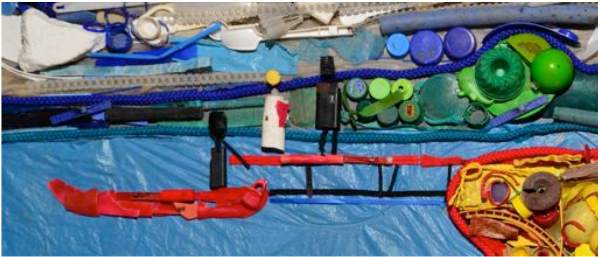
Utsnitt: Edvard Munch, Melankoli 1893, Fevang skole, 2013.

Edvard Munch (1863 – 1944) har gjort Åsgårdstrand og Vestfoldnaturen kjent for millioner av kunstinteresserte mennesker verden over. I de korte sommernettene ved fjorden fant han det særegne halvlyset som gløder i mange av hans beste og mest kjente bilder. I Åsgårdstrand fant Munch også den myke, buktende strandlinjen som går igjen i mange av de maleriene, tegningene og grafiske trykkene han skapte. Et av de mest gripende bildene herfra heter Melankoli. Munch malte flere versjoner av dette motivet.