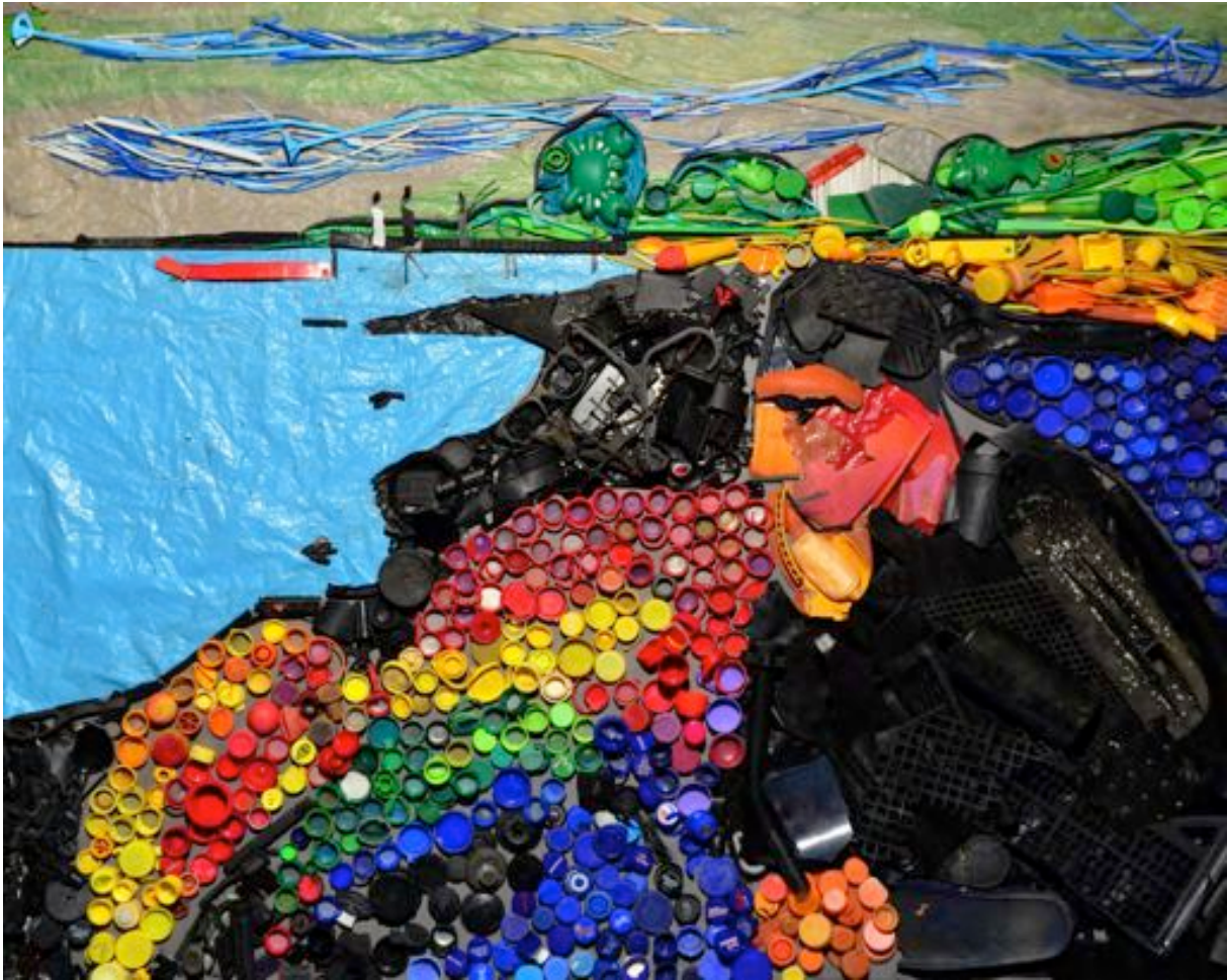
Edvard Munch, Melankoli 1894 - 96, Sandefjord byskole, 2013.