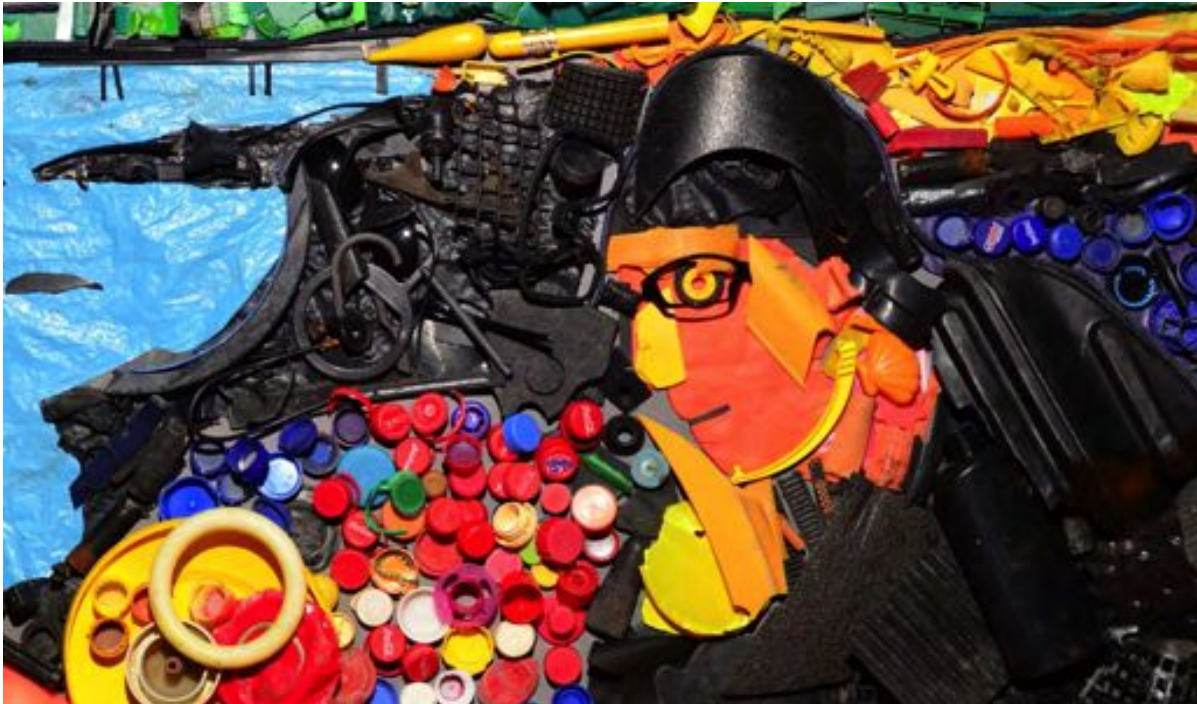
Utsnitt: Edvard Munch, Melankoli 1894 - 96, Framnes skole.