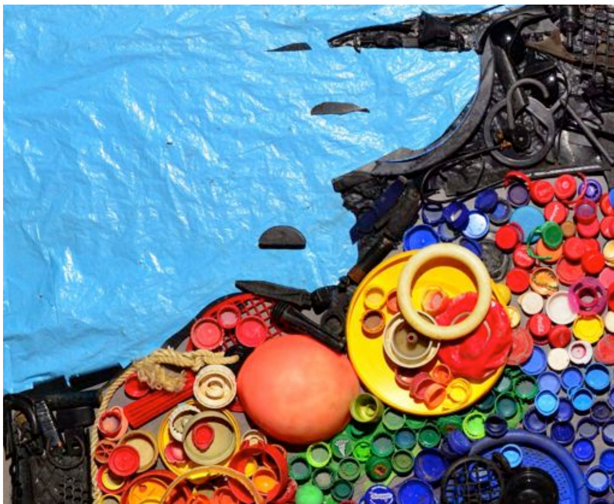
Utsnitt: Edvard Munch, Melankoli 1894 - 96, Framnes skole, 2013.

Vi kan ikke flykte fra naturen. Den er alt vi har. Dagnes barn og unge vokser opp med økende mengder plastsøppel på strendene. I kunstprosjektet Melankoli forsøker vi å belyse de kompliserte årsakssammenhengene som fører til denne menneskeskapte situasjonen.